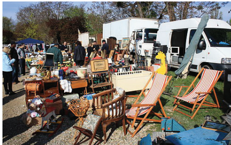
Les puces, une manne qui échappe à la commune voisine de Palavas.

Pour la saison d'été, l'emplacement est loué pour la somme forfaitaire de 21 600 € soit environ 5 à 6 € par jour et par manège. Prix comprenant le camping pour les forains le long du canal et le parking pour les camions gratuits. La même surface de terrain rapporte 10 fois plus à la mairie