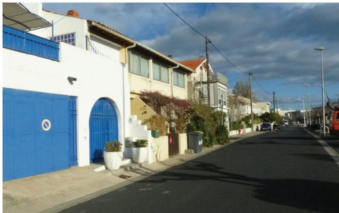
La rue du Jeu de Boules, la plus inondable de Carnon !

Les risques d'inondation à Carnon Ouest ne cessent d'augmenter.