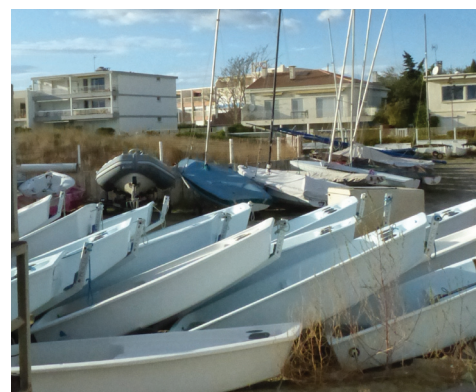
La future école de voile respectera-t-elle les servitudes vis-à-vis des riverains ?

le maire de Mauguio sur la pointe en mer du terre-plein de l'avant-port de Carnon-Ouest. Or, ce terrain relève du domaine public maritime et n'appartient pas à la commune. Elle n'en a que la gestion. ■