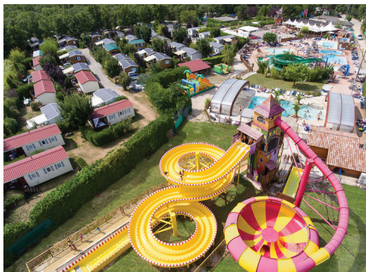
Le camping des Saladelles demain ?

À Carnon, l'exploitation du paisible camping des Saladelles vient d'être cédée par l'agglomération du Pays de l'Or au géant du camping 5 étoiles Capfun. Ce dernier compte investir 10 millions d'euros pour la création d'un parc aquatique sur le thème des pirates. Un coup de massue pour les habitués du lieu, au budget modeste, qui ne pourront pas suivre les tarifs à venir. Dans ce camping familial tout le monde se connaissait. Certains venaient depuis 25 voire 30 ans et d'autres y restaient durant six mois de l'année. Terminé, cela ne sera plus possible. Le nouvel exploitant prévoit d'installer 80% de mobil-homes ce qui ne laissera de la place que pour 50 à 60 caravanes contre 350 aujourd'hui. Très inquiets également, les riverains, qui redoutent, entre autres, les trois soirées d'animation par semaine ainsi que le bruit des jeunes pirates.