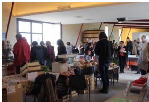
Le mauvais temps a nécessité un repli vers un abri gracieusement offert par le domaine viticole de l'Enclos de la Croix à Lansargues

La « Semaine pour les alternatives aux pesticides », organisée pour la troisième année consécutive par la Fabrique citoyenne du Pays de l'Or avec le Collectif 34 pour les alternatives aux pesticides, a permis de mettre au cœur du débat public