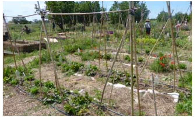
Aux jardins partagés, la Fabrique citoyenne démontre que l'on peut s'organiser de façon démocratique et participative

Depuis le début 2017, les jardins de la Fabrique ont participé à de nombreuses manifestations et co-organisé la « Semaine pour les alternatives aux pesticides » (SPAP) qui s'est formidablement passée (voir ci-dessous). Prochainement, une association va être créée pour donner encore plus d'ampleur à l'édition 2018.