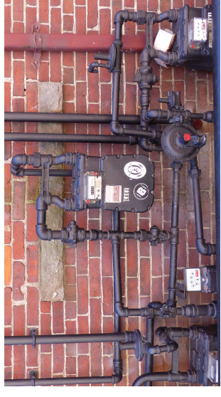
Victime de surfacturation d'eau ? Contactez-nous pour mener une action de groupe et interpeller les services concernés.

De nombreux citoyens nous ont contactés après avoir reçu un courrier les informant d'une consommation anormale d'eau. Certains se retrouvent à devoir payer à Véolia-Saur des factures considérables, sans commune mesure avec leur consommation habituelle.