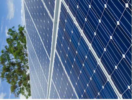
Tous les citoyens intéressés par la production d'énergie renouvelable peuvent nous rejoindre sur ce projet fédérateur.

Après avoir établi le montage juridique et financier, il nous faudra trouver les espaces de