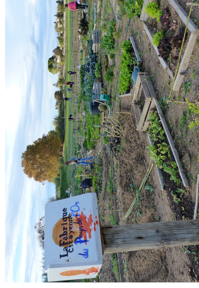
Le plaisir de travailler la terre ensemble, de récolter ses légumes, de faire des expériences et d'apprendre avec les autres.

pesticides. Sur les larges parcelles collectives qui entourent les petites exploitations, en plus des techniques traditionnelles, la culture sur paillis, sur buttes, ou la permaculture.